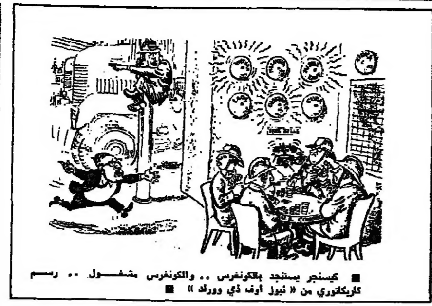
كيسنجر يستجد بكونغرس .. والكونغرس يشغول .. رسم كاريكاتوري من « نيوز أوף ذي وورلد »

وما كانت للولايات المتحدة شأنها الضخمة الأخرى ، داخليا وخارجيا ، مثل مشكلات الشرق الأوسط ، والكساد الاقتصادي والبطالة ، ومشكلات تركيا واليونان ، والريثاق ، والوقواق الأمريكي السوفياتي ، ولكن كل هذه المشكلات لم تعني دولة مضمون « التزاماتها » التقيمية في نيتام والهند الصينية ، على الأقل في نظر الرأي العام الأمريكي ؟ وقد يعزز هذا التصريح مسلك الرئيس الفيتنامي الجنوبي ، كما كشف عنه بعض كبار المبعوثين السبعين الأمريكيين ، مثل جيمس ريبسون أميس ، من أن ثوب قد حفر واشنطن من الخطر الذي ، منذ ظهور بوارده الأولى ، كان التواتر التقيمية التقيمية التي كتبت في مجموعها الآخر قد استغرق حشدتها وأعدادها الهائلة منذ شهر . . . وعندما لفحت وهدأها الأولى تمثل إلى وقتها في نيتام الجنوبية ، الجانب تواتر التواتر ( كينغتون ) أرسل ثوب ولدا روسيا إلى واشنطن للبحث في مدى المساعدة التي يمكن أن تقدمها بلاده من قبلها أمريكا . . . وقد رفض زعماء البحرية الفيتنامية والناحية الجمهورية